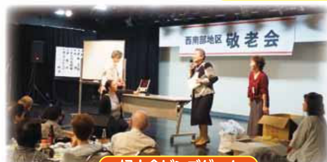
婦人会ビンゴゲーム