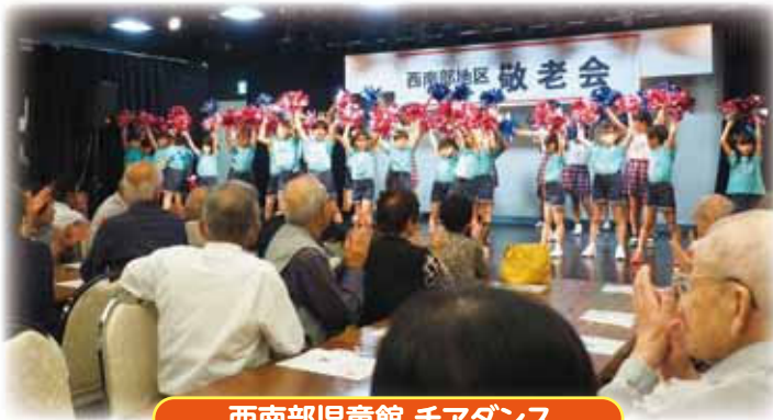
西南部児童館 チアダンス