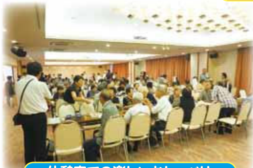
休憩室での楽しいおしゃべり