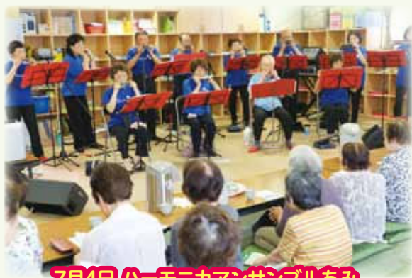
7月4日 ハーモニカアンサンブルあり