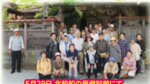
5月29日 北前船の里資料館にて